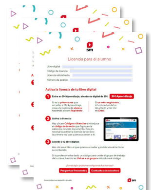
Licencia digital e instrucciones.